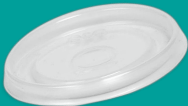
Крышка OSQ Round Bowl PP lid 100

Контейнеры и крышки заказываются отдельно