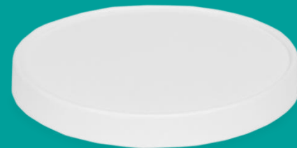
Белая картонная крышка OSQ Round Bowl 300-500 White