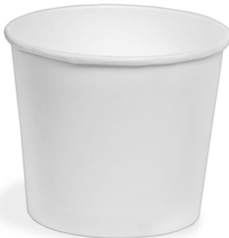
OSQ Round Bowl 500 White